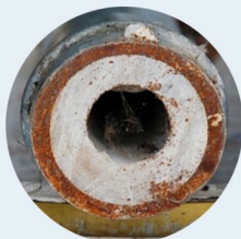
Entartrage Sans HOME0 DEKALC