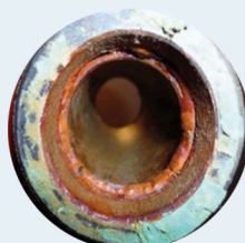
Avec HOME0 DEKALC