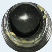
Elimination du Biofilm avec HOME0 DEKALC